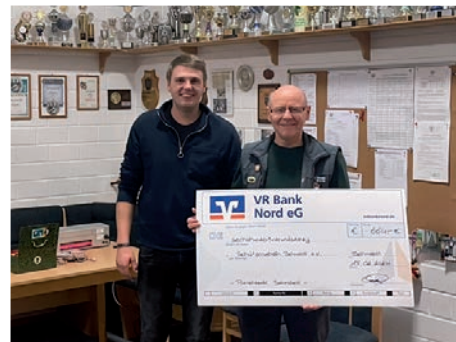
Auch der Schützenverein Bohmstedt wurde von den Punschbudenbetreibern bedacht und konnte eine Spende über 664€ entgegennehmen.