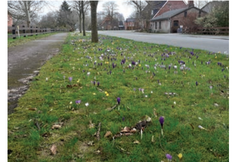
Krokusse: Seit mehreren Jahren setzen die Frauen der Sportgruppe im Herbst Krokuszwiebeln, so auch im letzten Jahr. Mit ihrer lebendigen Farbe bringen die Frühblüher einen Hauch von Frühling in unser Dorf und erfreuen jung und alt.