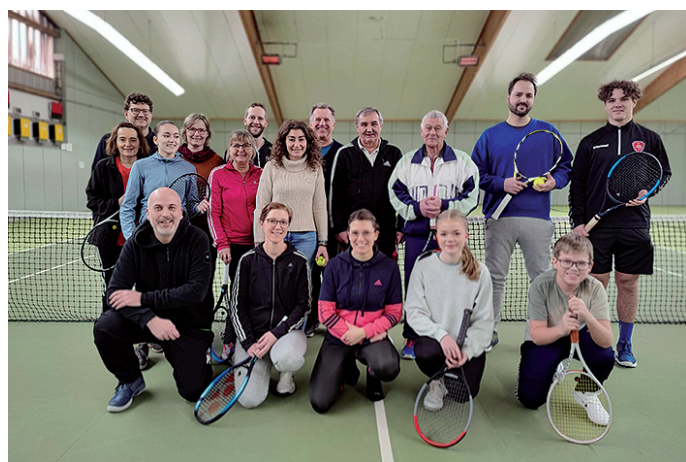
Beim Neujahrsturnier 2024 trafen sich Mitglieder des TCB und Gäste zum Mixed-Doppe in der Tennishalle. Quer über die Generationen wurde gemeinsam Tennis gespielt.