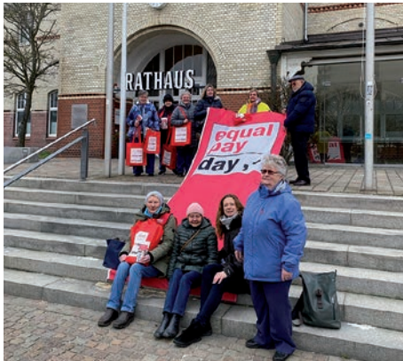
Aktion zum "Equal Pay Day" vor dem Westerland Rathhaus auf Sylt.