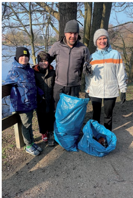
Bei strahlendem Sonnenschein machten sich auch ganze Familien auf zum „Schietsammeln“ in Bredstedt.