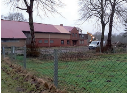
Das Dorfbild verändert sich: Über 200 Jahre stand hier im Bohlweg ein landwirtschaftlicher Betrieb. Wohnhaus, Ställe und Schuppen wurden abgerissen. An dieser Stelle entsteht jetzt ein Neubaugebiet.

alle, die kommen, etwas dazu beitragen würden. Für alle die mit dem Fahrrad dorthin fahren möchten, ist der Treffpunkt um 9.30 Uhr bei der alten Schule. Auf einen schönen Himmelfahrtstag!